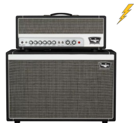
Léo - G2