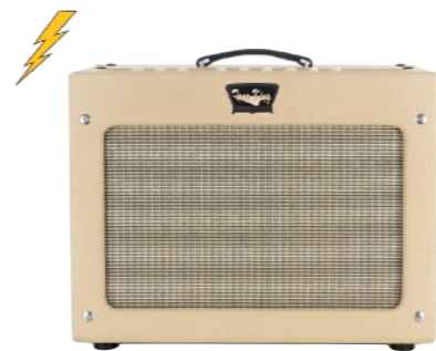
Jason - G1